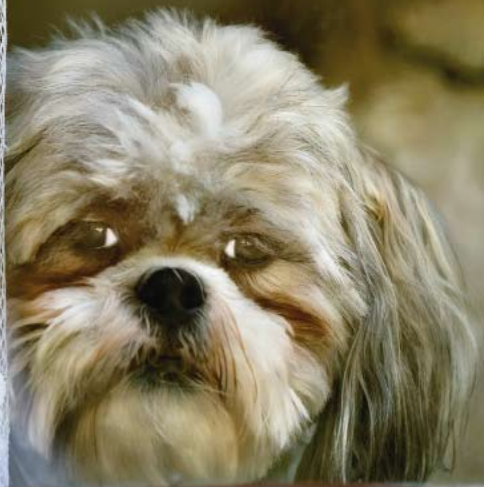
SUCK. Den kärleksranke lille shih tzun deppar och längtar ut.